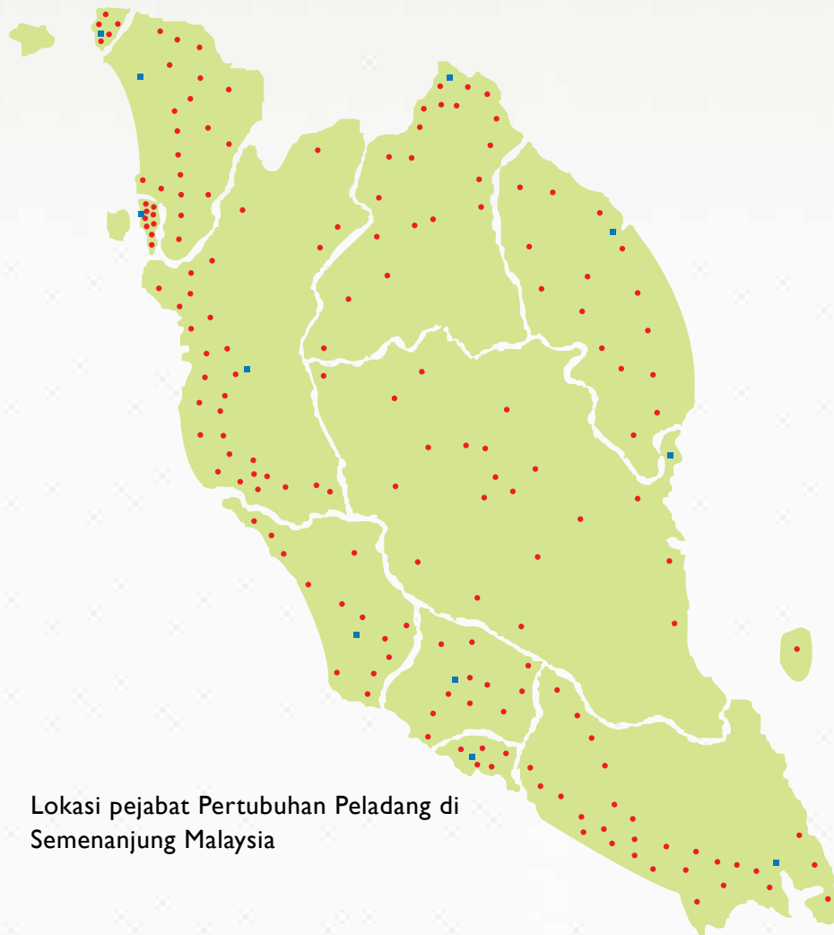
Lokasi pejabat Pertubuhan Peladang di Semenanjung Malaysia