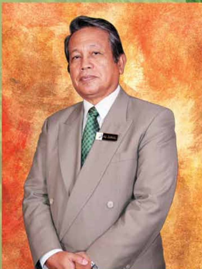
DATO' HAJI ZAINAL BIN DAHALAN PENGERUSI LEMBAGA PERTUBUHAN PELADANG